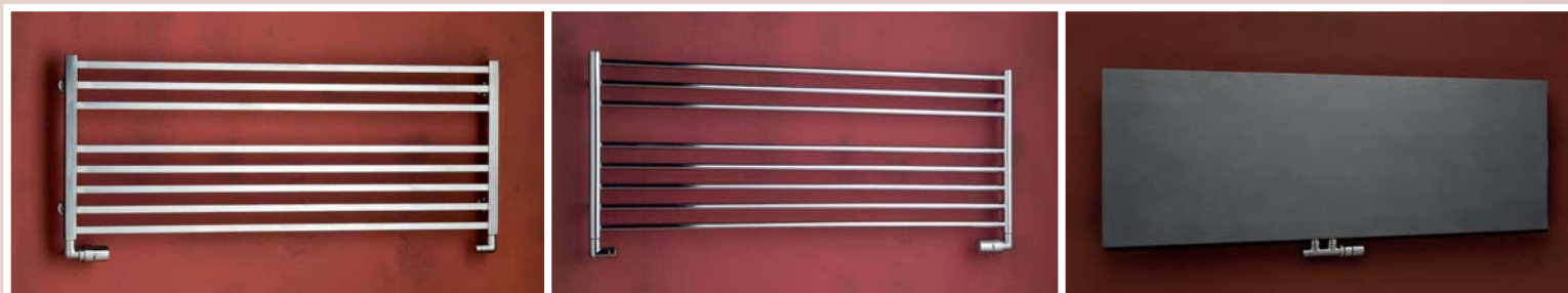
AVENTO 905 × 480 [422W] 1210 × 480 [484W]