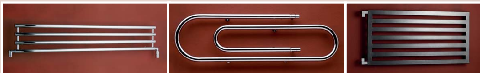
ROSENDAL 950 × 266 [248W] 1500 × 266 [350W]